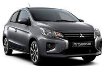
TITANIUM GREY Metallic