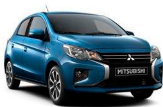
CERULEAN BLUE Metallic