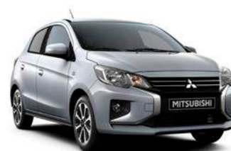
COOL SILVER Metallic