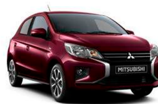
RED WINE Pearl