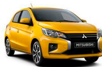
SAND YELLOW Metallic Neu