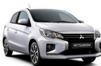
WHITE DIAMOND Premium-Metallic Neu