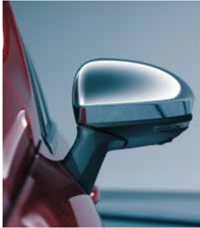
▲ Coques de rétroviseurs extérieurs Chrome.