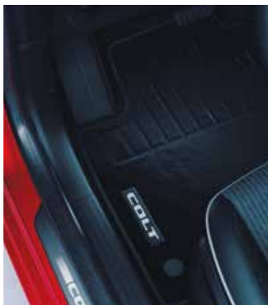
▲ Jeu de tapis en textile Comfort ou elegance.