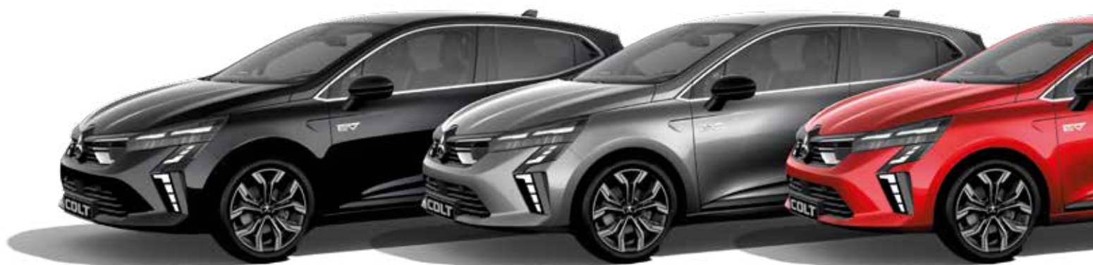
Onyx Black Metallic ▲

Le système MULTI SENSE vous permet de personnaliser de nombreux réglages du COLT. Choisissez parmi 3 modes de conduite : Eco, Sport et My Sense. Pour une personnalisation complète, vous pouvez changer le mode de direction et régler l'éclairage ambiant. Vous pouvez également personnaliser l'affichage graphique sur le tableau de bord devant le conducteur.