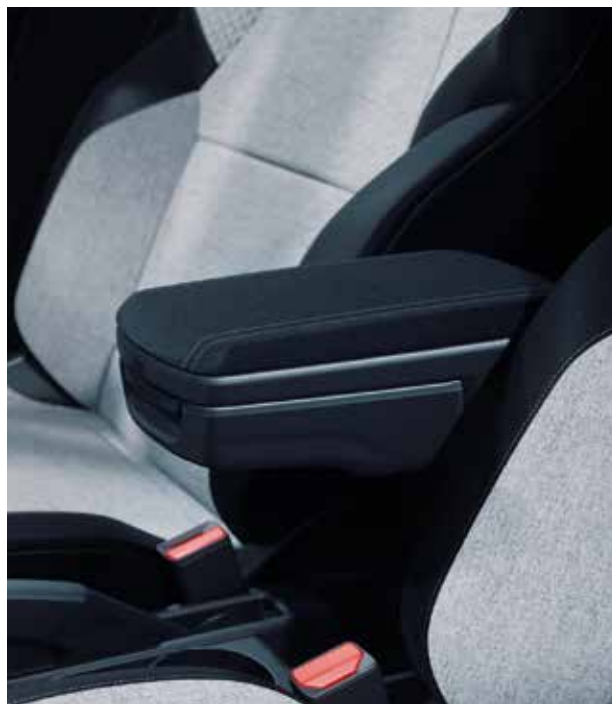
▲ Espace de rangement dans l'accoudoir