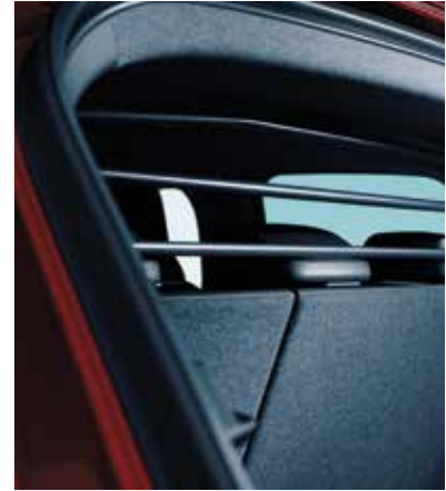
▲ Grille de séparation Finition noire.