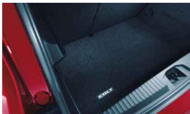
▲ Bac de coffre Avec le logo COLT. Facile à installer.