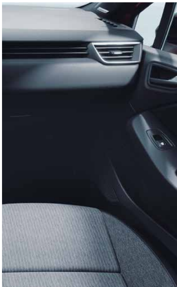
▲ Boîte à gants