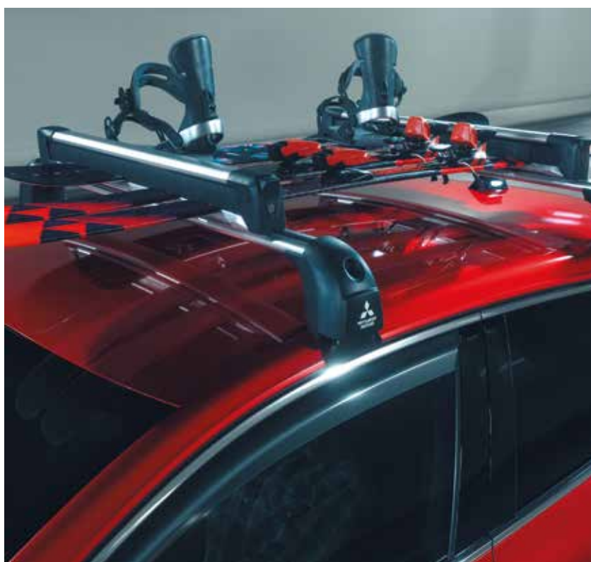
▲ Barres de toit