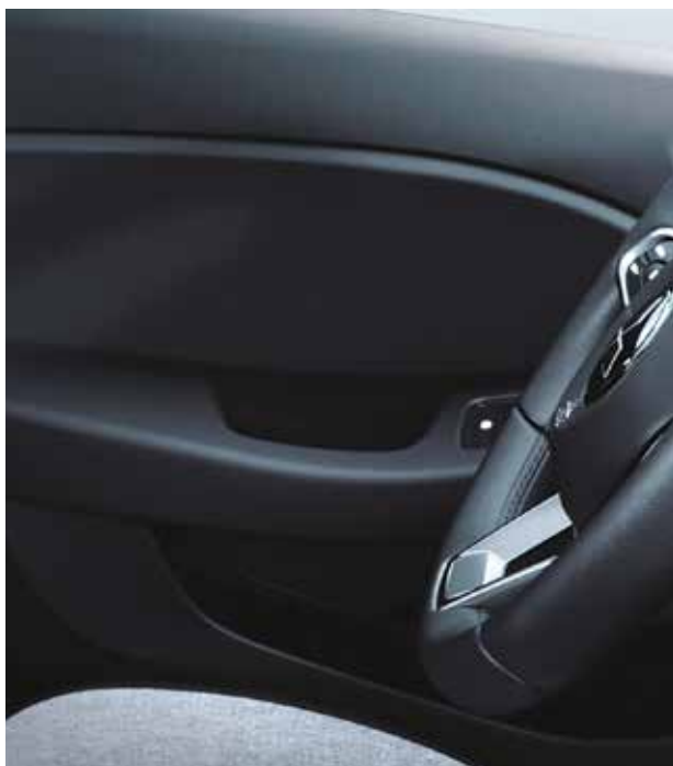
▲ Casiers de porte