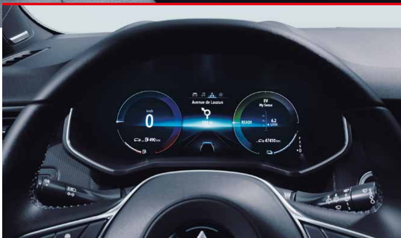
Tableau de bord numérique avec 10"-Display

Le tableau de bord affiche clairement une représentation simple de la navigation. Tous les affichages et les informations importantes concernant le voyage sont visibles par le conducteur directement au-dessus du volant.