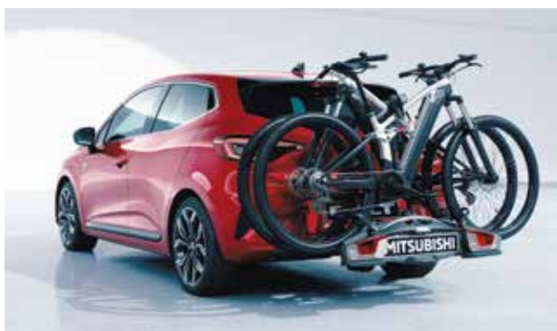
▲ Porte-vélos Plusieurs modèles disponibles.