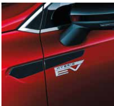
▲ Habillage latéral Disponible en différentes couleurs.