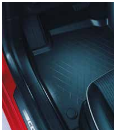
▲ Jeu de tapis en caoutchouc