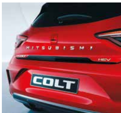
▲ Garniture de hayon Disponible en différentes couleurs.