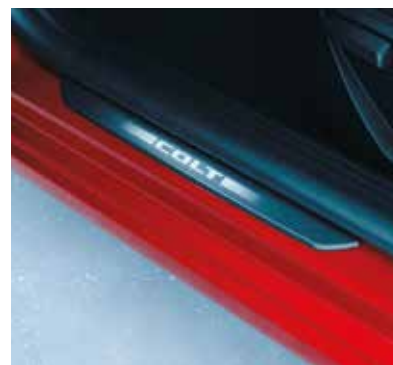
▲ Seuil de porte Disponible également avec éclairage.