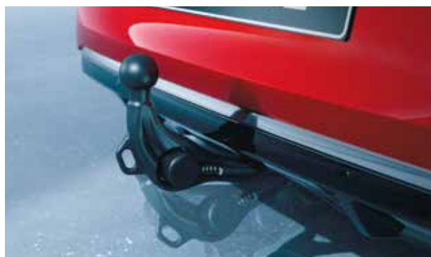
▲ Kit d'attelage Fixe, amovible, rétractable.