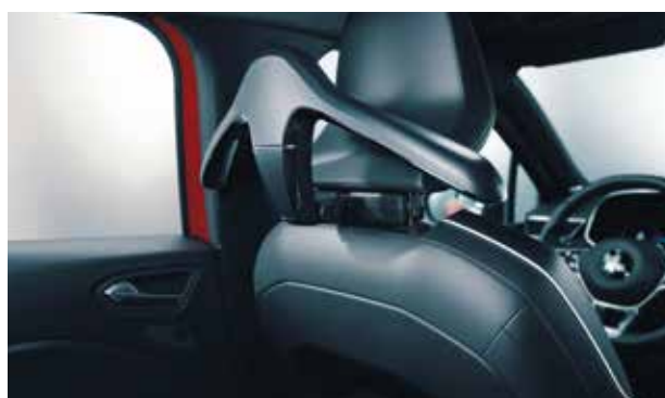
▲ Base multifonctionnelle pour appuie-tête Plusieurs pièces de montage disponibles.