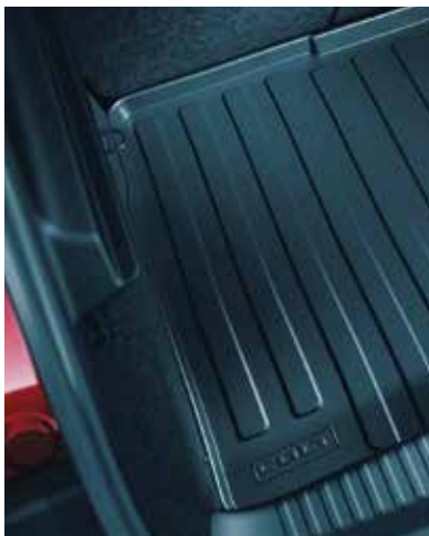
▲ Bac de coffre Réversible.