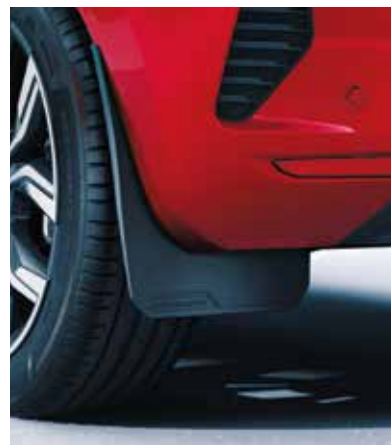
▲ Bavettes Pour l'avant et l'arrière.